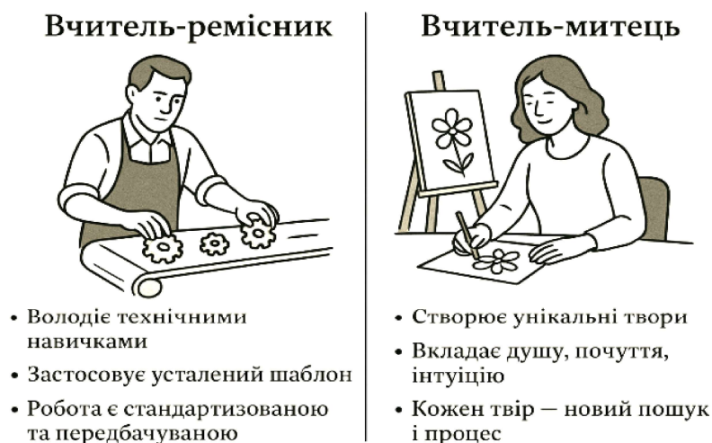
Рис. 1. Дві моделі підходу вчителя: ремісник і митець.

Василь Сухомлинський вважав, що педагогічна діяльність – це мистецтво творити Людину. І саме це дає змогу порівняти «вчителя-митця» та «вчителя-ремісника». Ця ідея є основою його гуманістичної педагогіки (див. рис. 1).