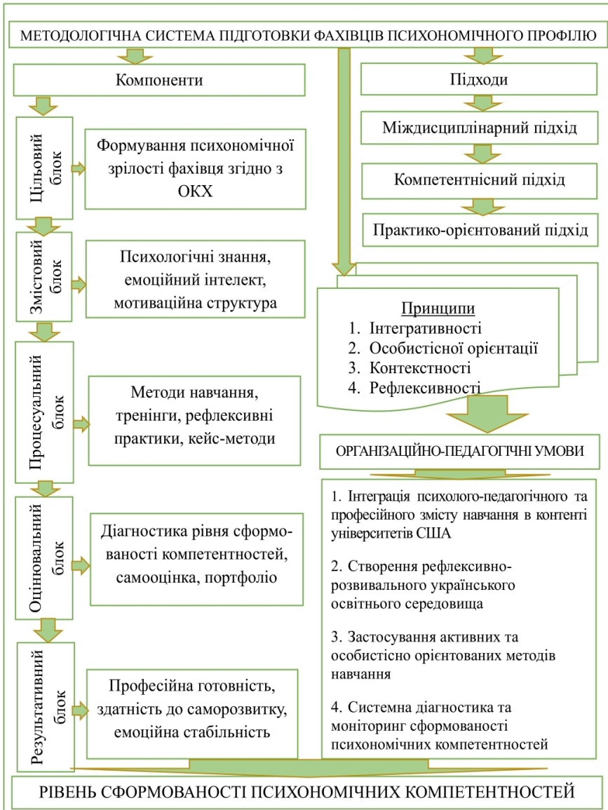
Рис. 1. Модель формування психомічних компетентностей в підготовці фахівців щодо сучасних професійних освітньо-кваліфікаційних характеристик

підтвердити її практичну дієвість у контексті модернізації української системи вищої освіти (CACREP Standards, 2024).